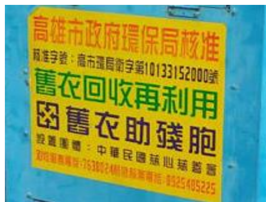
圖 3 環保單位核准標示