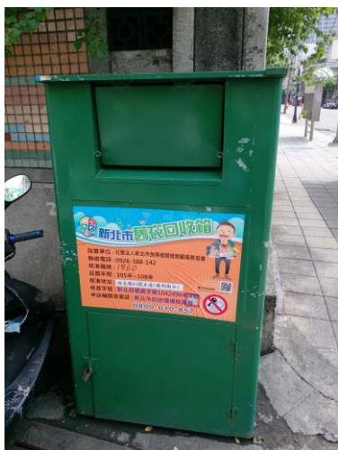
圖 2 合法舊衣回收箱