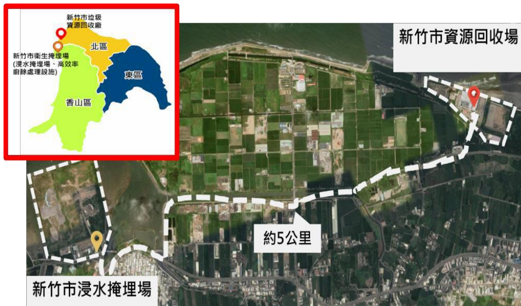
圖 1 新竹市廢棄物處理整體園區規劃範疇示意圖

源自行政院環境保護署推動廢棄物整體園區之概念，考量各類廢棄物於園區處理、轉化及能資源再利用，達成以廢轉能、減碳淨零之目標，因此「新竹市多元廢棄物循環及環境教育園區」範疇係規劃由新竹市轄內兩大主要廢棄物處理設施共同組成，亦即「新竹市垃圾資源回收廠」及「新竹市浸水衛生掩埋場」，其中兩地相距僅約5公里。